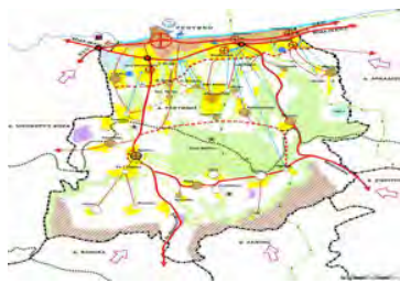
Γ.Π.Σ ΔΗΜΟΥ ΡΕΘΥΜΝΗΣ 2011